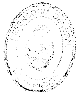
STELLA MARIS MARTÍNEZ DEFENSORA GENERAL DE LA NACIÓN

Protocolícese, mágase saber y oportunamente archívese.